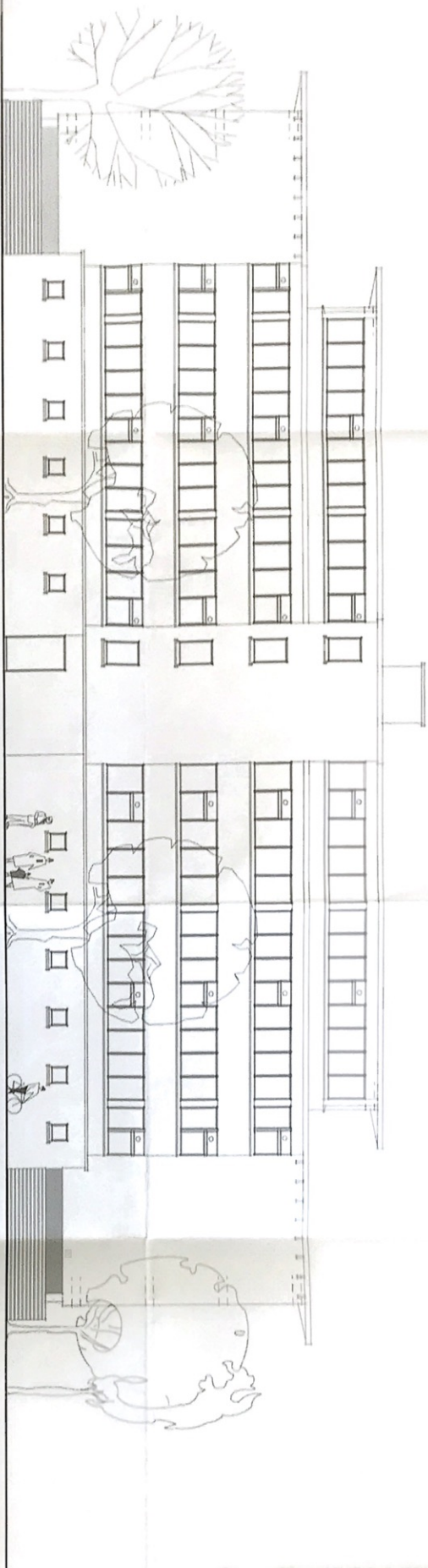
Ansicht Nordseite - Bahnseite